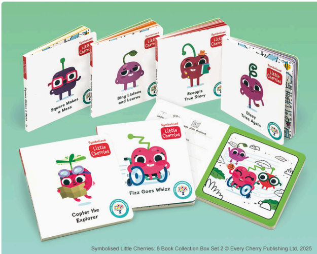
Symbolised Little Cheries: 6 Book Collection Box Set 2 © Every Cherry Publishing Ltd, 2025

いろいろなチェリーたちが暮らしているハッピー・ヒルズ・オーチャードを舞台にした絵本の新作セット。文章はとてもシンプル。単語の上に絵文字やシンボルがついており、多様な子どもたちの読書をサポート！ QRコードから朗読音声や身振りサインの動画にアクセスすることもでき、英語を学び始めた子どもたちにも適しています。